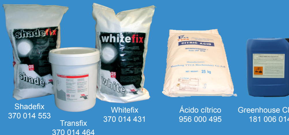
Shadefix 370 014 553