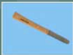
Cuch. Hoja Brinkman redondo 39 mm 52-100-109