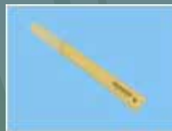
Cuch. Hoja tomate molen 1460 351-000-712