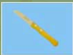
Cuch. Derecho pvc/acero 63mm 10uds 352-010-207