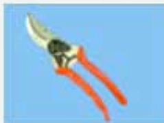
Felco tijera de poda n°5 347-006-051