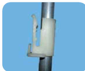
8 Grapa abrazadera Selfa (900 002 277)