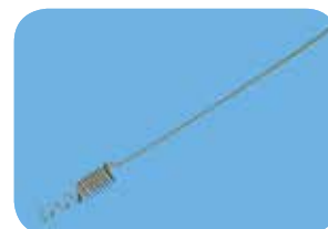
Enganche de muelle 1,5 mm 16 + 4 cm cónico (900 002 522)