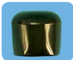
3 Tapón negro redondo 30mm K 30 (902 000 306)