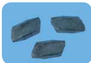
Grippe pequeño Crisantemo 1,4 - 2,2 (953 002 088)