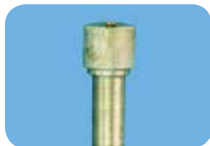
Llave de tubo para enganche de muelle con bucle (900 002 395)