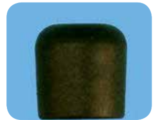
2 Tapón negro redondo 13 mm K-PE (902 000 136)