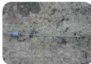
Enganche del muelle 1,5mm 10cm + bucle (900 002 417)

(*) El enganche de muelle puede unir el ángulo derecho con el espiral a la malla