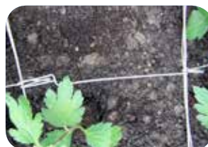
Puente de malla 120 mm ojo + gancho (900 002 702)