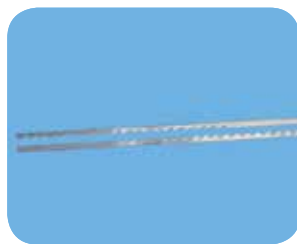
7 Soporte T con 20 ranuras 150cm (940 503 301)