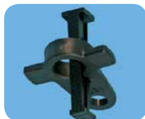
4 Grapa Selfix de 13 mm (900 002 301)