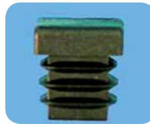
1 Tapón negro cuadrado 15x15mm (902 001 159)