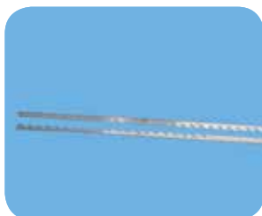
7 Soporte en T con 15 ranuras 120cm (900 007 079)